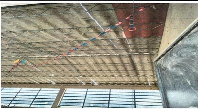
Foto 3: sustitución de capote de lámina por capote de lámina calibre 24