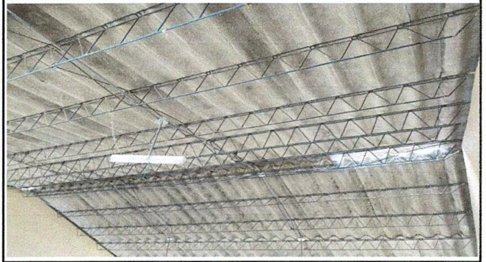
Foto 2: sustitución de elementos de fijación para lámina troquelada.